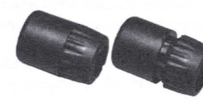
Nakrętka z gwintem (B)