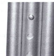
Pilot zatrzaskowy (C)